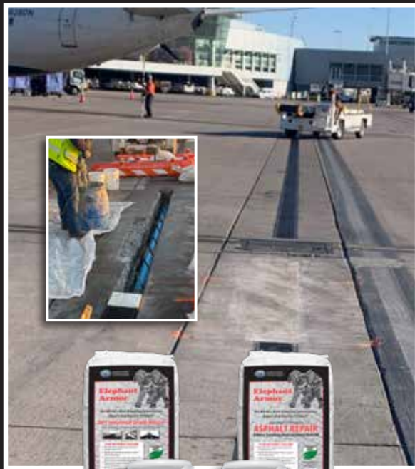
Elephant Armor® DOT

¡El Producto Cementoso de Recubrimiento y Reparación Más Asombroso del Mundo!