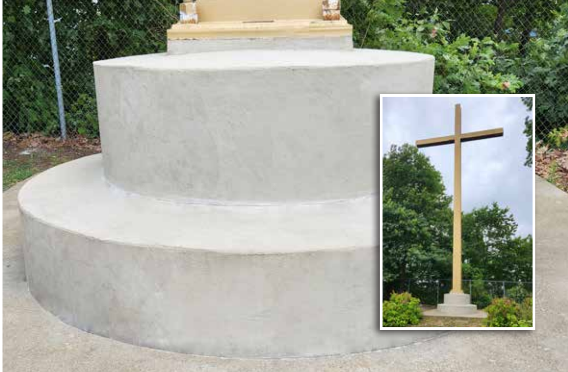
La facilidad de uso de Surface Armor y su rápido tiempo de fraguado permitieron reparar la base de forma permanente en menos de 2 horas, con una interrupción mínima del santuario.