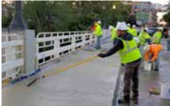
Acabado de Elephant Armor® con jalón* GST. (*GST Squeegee Trowel)