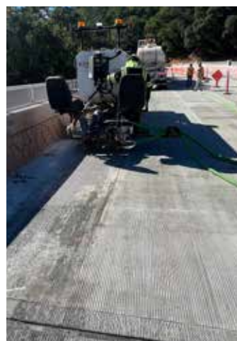
Una vez que la segunda capa se cure, una máquina ranuradora aplica la textura especificada.