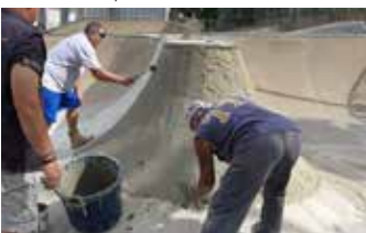
Elephant Armor® aplicado con llana y rodillo GST, sin necesidad de cimbrar.