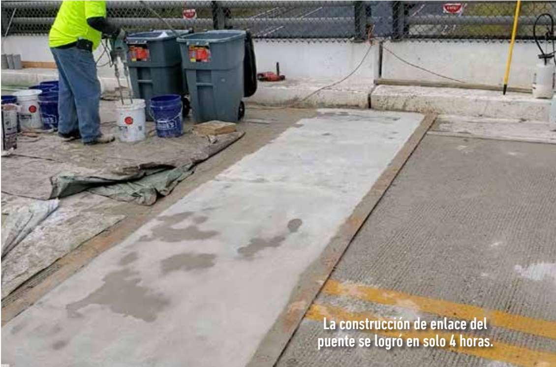
La construcción de enlace del puente se logró en solo 4 horas.

Se eligió Elephant Armor® debido a su alta resistencia a compresión, flexión y tracción. Su propiedad de fraguado acelerado permite reabrir el tramo a servicio rápidamente.