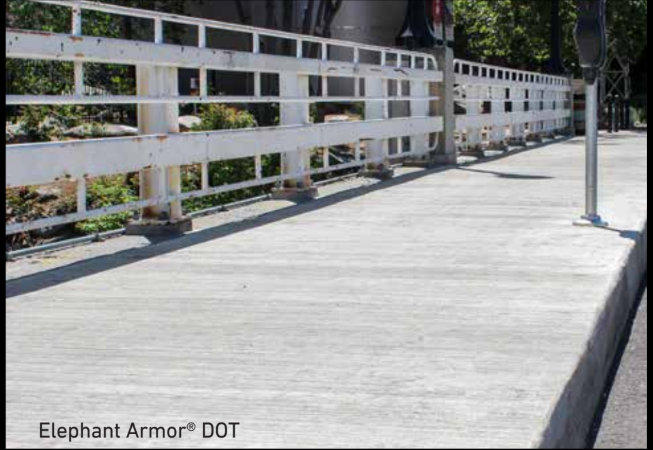
Elephant Armor® DOT