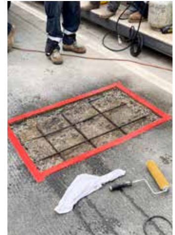
Área de reparación limpia, estable y "seca saturada de superficie" (SSD) antes de la colocación de Elephant Armor®.