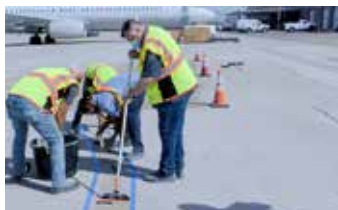
Relleno de grietas con Elephant Armor® utilizando un rodillo y un GST Squeegee Trowel.