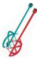
Aspas de repuesto para ColloMix Xo 55