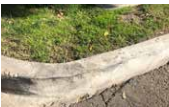
La reparación con Elephant Armor® puede soportar el uso pesado inmediatamente.