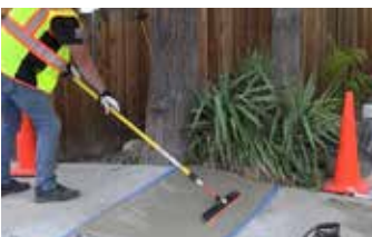
Preparación de la superficie para un acabado con escoba.