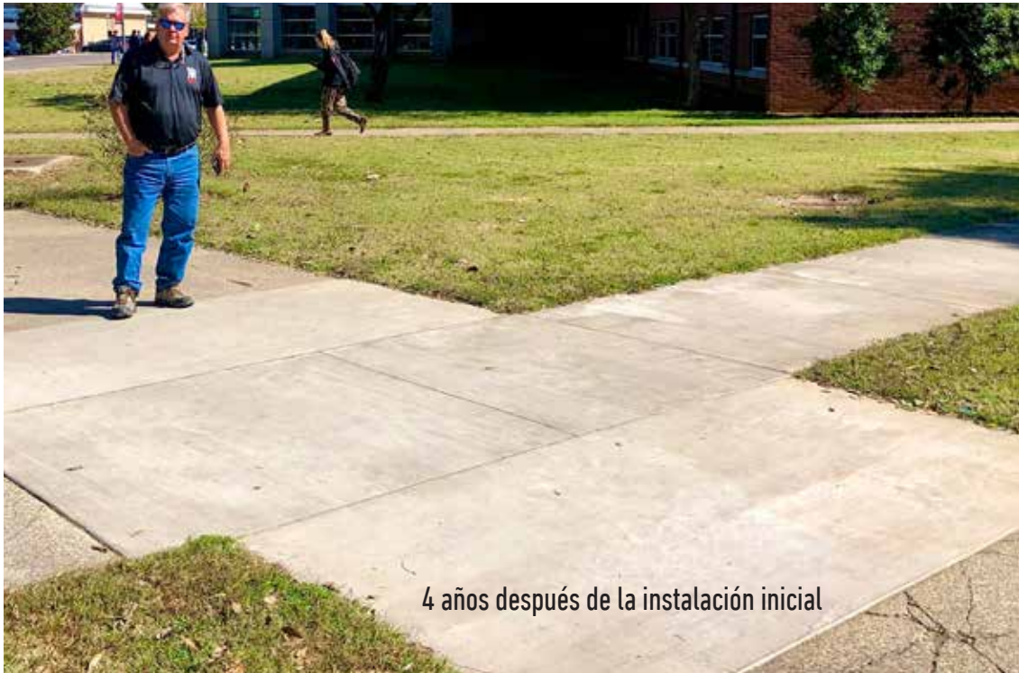
4 años después de la instalación inicial

Se realizó una demostración de reparación de aceras en la Universidad MTSU, comparando el método tradicional de demoler y volver a colar, contra el recubrimiento con Elephant Armor®.