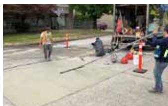
Terminado final del Elephant Armor en capa de 1/4" (6mm).