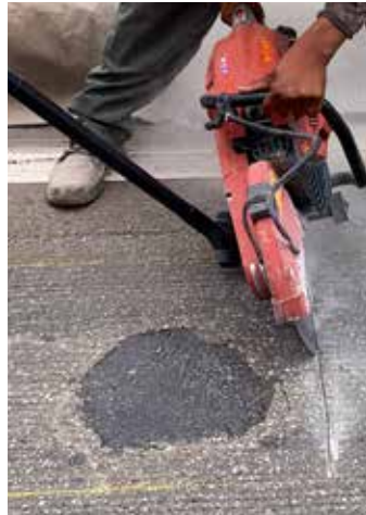
Es importante hacer cortes con una sierra alrededor del perímetro de la zona a reparar.