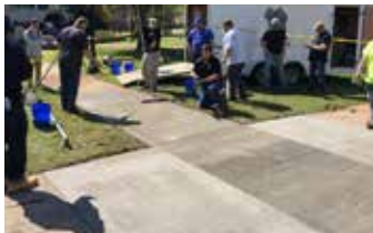
Afinado del Elephant Armor® con un jalador GST antes de aplicar un acabado escobillado.