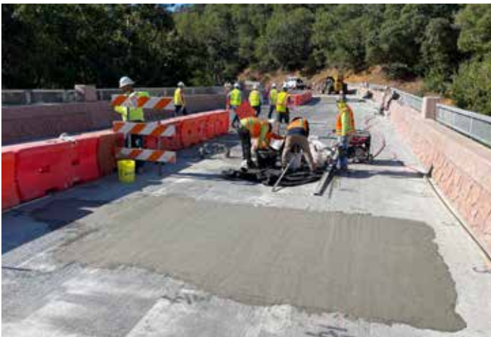
Las zonas con barras de refuerzo expuestas se rellenan y encapsulan con Elephant Armor® antes de la aplicación final de Elephant Armor® DOT.