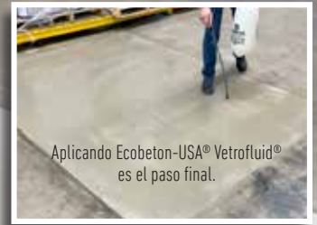
Aplicando Ecobeton-USA® Vetrofluid® es el paso final.