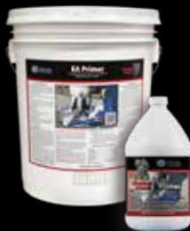
Elephant Armor® Primer