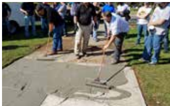
Aplicación de lechada de Elephant Armor® para relleno de grietas y en área general.