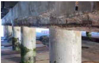
Concreto dañado y en mal estado removido y preparado para la aplicación de Elephant Armor®.