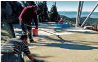
Elephant Armor® aplicado con rodillos y llanas GST.