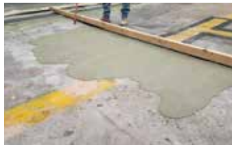
Elephant Armor® se aplica en tres paneles para rellenar y nivelar el área de reparación.