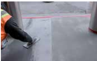
Usando una llana para completar la primera capa de Surface Armor®.