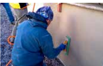
Se usa una paleta flotante para lograr el acabado deseado antes de la aplicación final de Vetrofluid®.