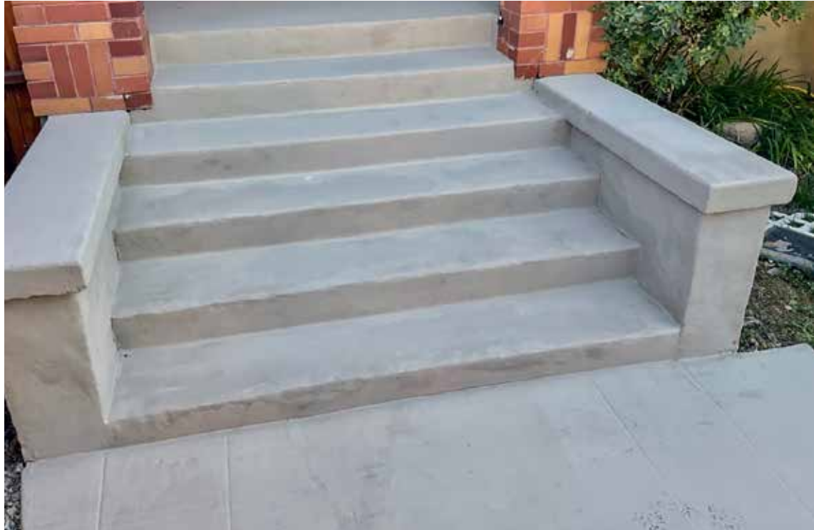
Restauración completa en 5 horas utilizando una bolsa de Elephant Armor® DOT y una bolsa de Surface Armor™ sin necesidad del tradicional costoso y largo proceso de deconstrucción/reconstrucción, alargando enormemente su ciclo de vida.