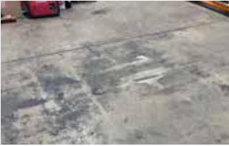
Panel del piso de una bodega dañada y antiestética antes de la repavimentación.