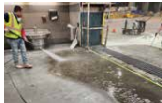
Se lava el área a reparar y se retira todo el material suelto.