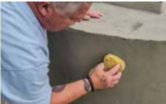
Se utiliza una esponja húmeda para alisar la Surface Armor™ y darle una textura suave.