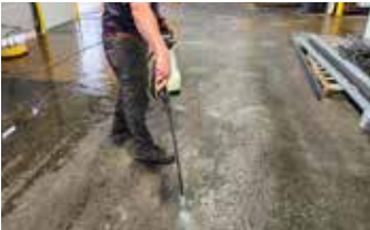
Limpiar el suelo con Pro-Grade Cleaner antes de aplicar Ecobeton® Vetrofluid.