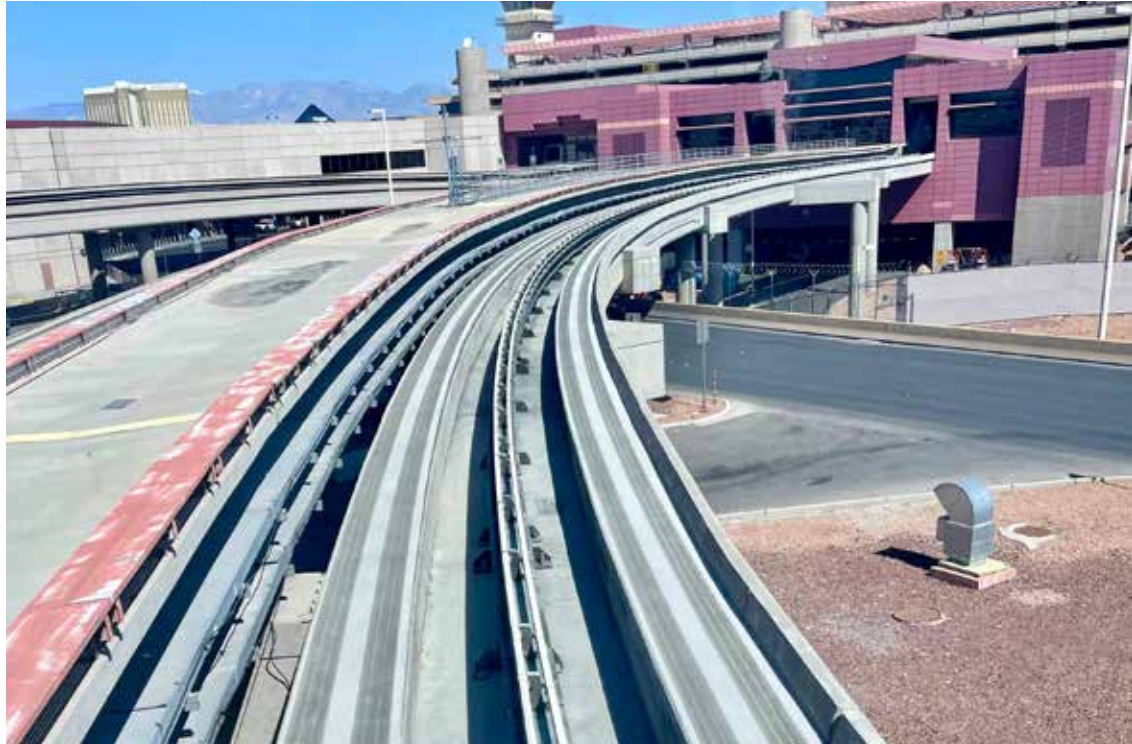
Surface Armor™ sustituye a los epoxis tradicionales para ofrecer una apariencia duradera y visualmente atractiva, y funciona a un costo reducido y en un plazo de tiempo acelerado.