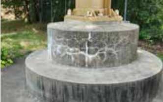
Hormigón envejecido que muestra grietas y calcio y formación de moho debido a la retención de agua.