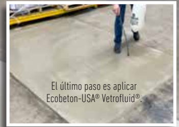
El último paso es aplicar Ecobeton-USA® Vetrofluid®.