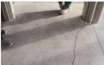
Panel de acera antes del relleno de grietas con la primera capa de Surface Armor™.