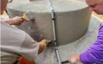
Aplique Surface Armor® con una brocha y luego un Squeegee Trowel para alisar las marcas de la brocha