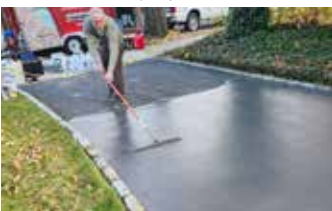
Driveway is given a new visual and service life with a final application of Ecobeton-USA® Vetrofluid®.