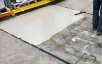
La primera capa de Surface Armor™ con un GST Squeegee Trowel.