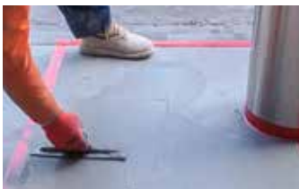
Aplicando la segunda capa de Surface Armor™ a la superficie antes de pasar la escobilla.