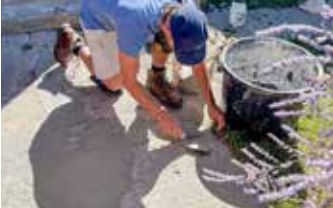
Elephant Armor® DOT se utiliza para rellenar todos los desprendimientos y grietas profundas.