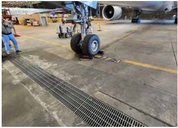
Foto que muestra daños extensos en el concreto alrededor de los desagües, incluida una depresión de 'carga puntual' de 3" en el área de estacionamiento en el tren de morro del avión.