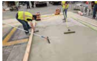
Elephant Armor® se coloca y nivela fácilmente con GST Squeegee Trowels y Rodillos.