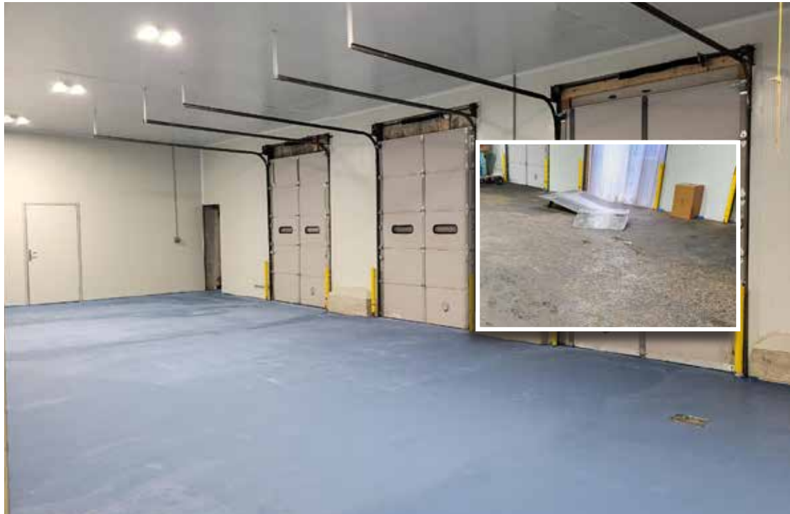
Surface Armor® es un micro-recubrimiento cementoso de alta resistencia que acepta pigmentos líquidos o en polvo. (no compatible con pigmentos granulares secados por pulverización).