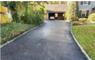
Worn out asphalt driveway prior to applying Surface Armor™.