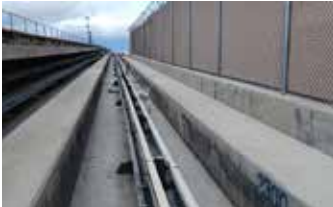
Se aplicaron dos capas de Surface Armor™ para mayor durabilidad y textura.