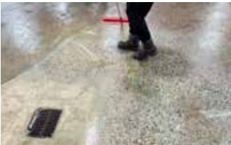
El constante tráfico de vehículos en un entorno húmedo y refrigerado ha provocado un gran desgaste.