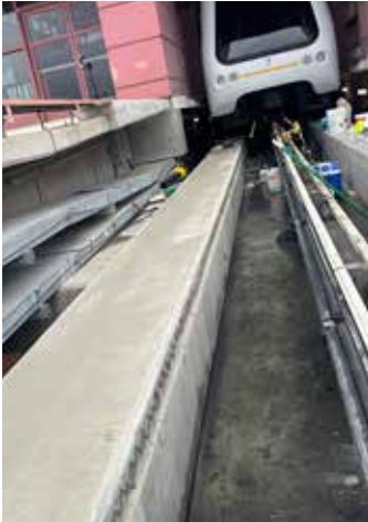
Ecobeton® -USA Vetrofluid® rociado antes de la aplicación de Surface Armor™.