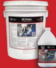
Elephant Armor® Primer