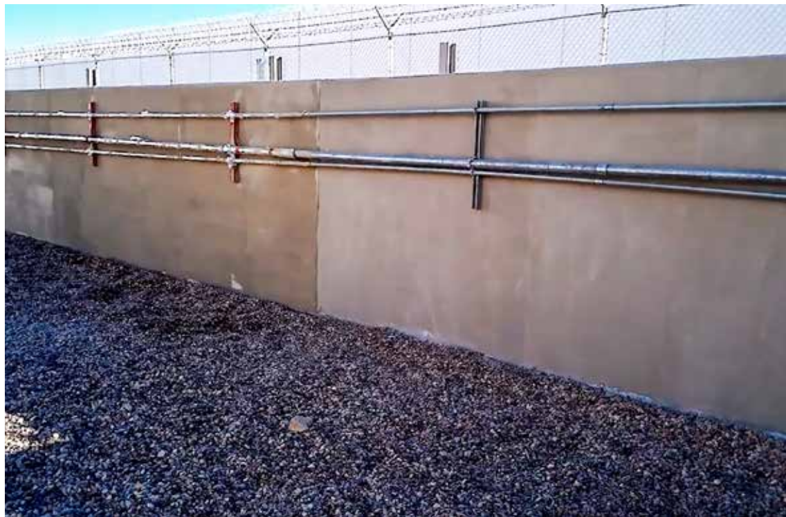
Una pared de bloques de CMU recién repavimentada con una apariencia 'como nueva' después de eliminar las grietas visuales y la decoloración. La pared ahora es impermeable y estructuralmente sólida.