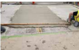
El panel central está relleno con Elephant Armor® hasta el nivel de los dos paneles exteriores.