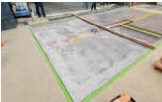
Se aplica una capa de EA Primer sobre el área de reparación.