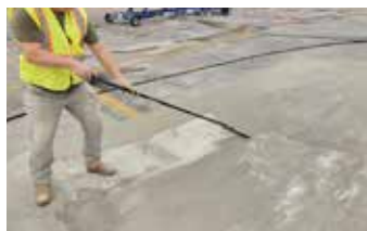
Se aplica una capa de Surface Armor™ sobre toda el área reparada (rellenada).