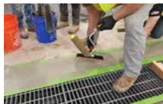
La segunda área dañada en el perímetro exterior del drenaje ahora está cubierta con Elephant Armor®.