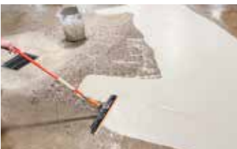
La aplicación de Surface Armor® es rápida y sencilla con un GST Squeegee Trowel.