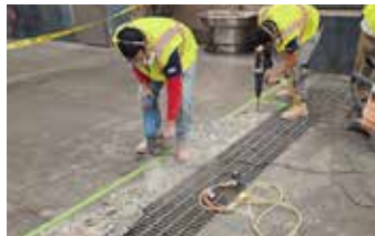
Todo el concreto inestable suelto se desmenuza para proporcionar una superficie sólida.