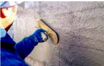
Se usa una llana para esparcir Surface Armor™ y lograr un espesor uniforme.