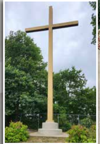
La facilidad de uso de Surface Armor y su rápido tiempo de fraguado permitieron reparar la base de forma permanente en menos de 2 horas, con una interrupción mínima del santuario.