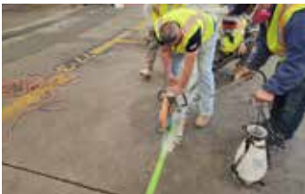
Se hacen cortes limpios alrededor del perímetro del área a reparar.

Se utilizó una combinación de Elephant Armor®, seguida de una capa de desgaste de Surface Armor™, para completar esta importante reparación. El relleno volumétrico, así como la remediación del descascaramiento y grietas profundas se realizaron con Elephant Armor® después de aplicar Ecobeton - USA® Vetrofluid® para estabilizar la superficie de concreto existente. Luego se usó Surface Armor™ para acabar la reparación con una capa muy delgada, mejorando la apariencia de la superficie. Luego se realizó una aplicación final de Ecobeton - USA® Vetrofluid® para mejorar en gran medida la durabilidad y extender el ciclo de vida. Elephant Armor® y el Sistema Surface Armor™ redujeron significativamente los costos en comparación con un escenario de 'quitar y reemplazar'.