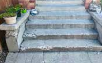
Escalera muy desmenuada y degradada, debidamente limpiada y sellada con Ecobeton® Vetrofluid®.