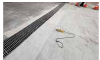
Reparación terminada lista para una mano de Ecobeton® - USA Vetrofluid®.