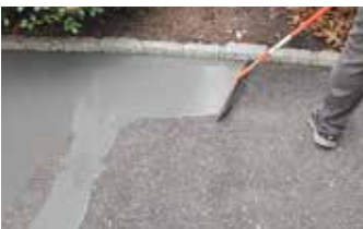
Applying Surface Armor™ is quick and easy with a GST Squeegee Trowel.