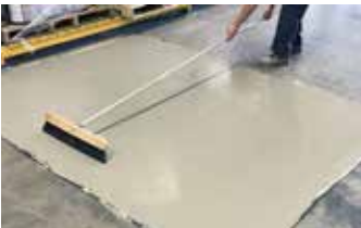
Se hace un acabado antideslizante con una escoba después de la segunda capa de Surface Armor™.