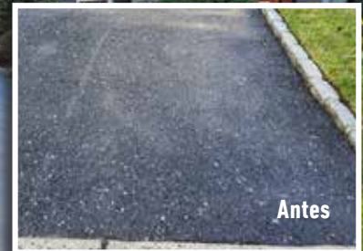
Powder pigment was added to the Surface Armor™ to achieve a similar finish to the original asphalt. The 1250 ft 2 driveway was completely resurfaced in approximately 5 hours.