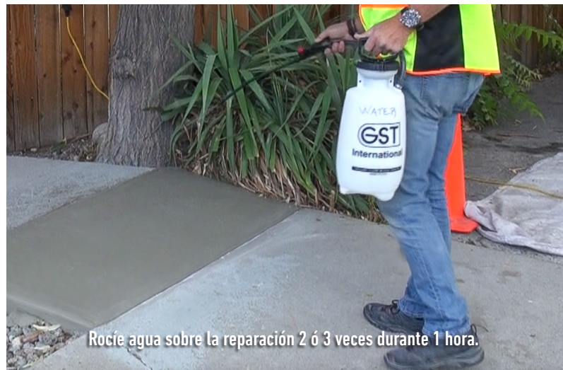
Rocíe agua sobre la reparación 2 ó 3 veces durante 1 hora.