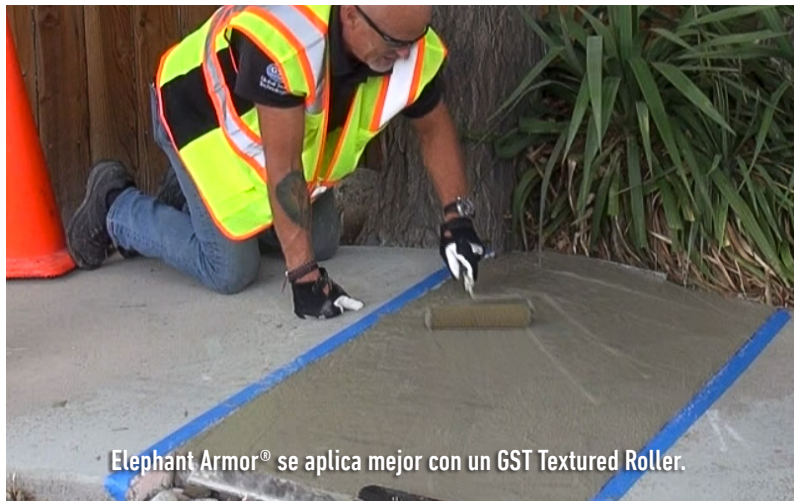
Elephant Armor® se aplica mejor con un GST Textured Roller.