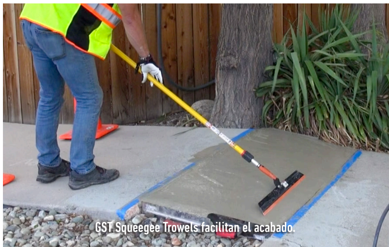
GST Squeegee Trowels facilitan el acabado.