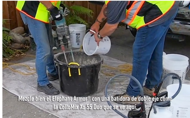
Mezcle bien el Elephant Armor® con una batidora de doble eje como la ColloMix Xo 55 Duo que se ve aquí.