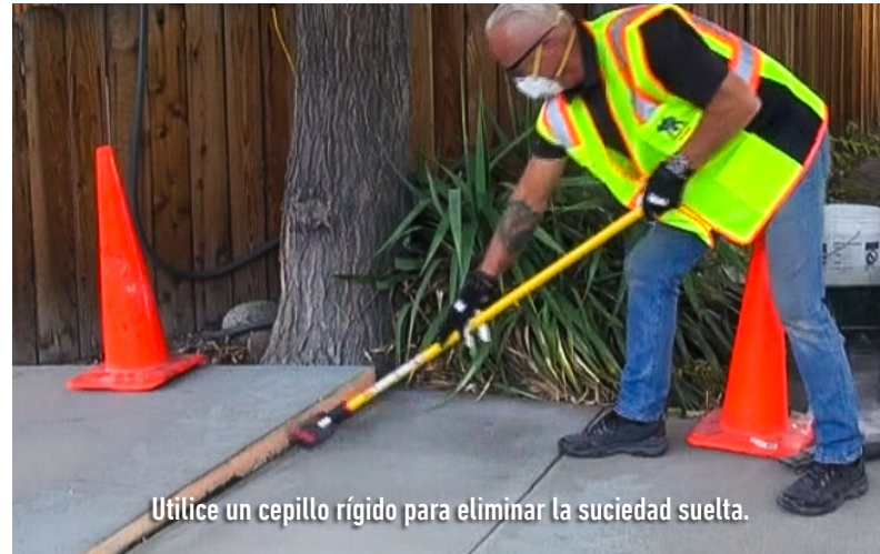
Utilice un cepillo rígido para eliminar la suciedad suelta.

Ver información detallada sobre EA Primer Slurry Coat