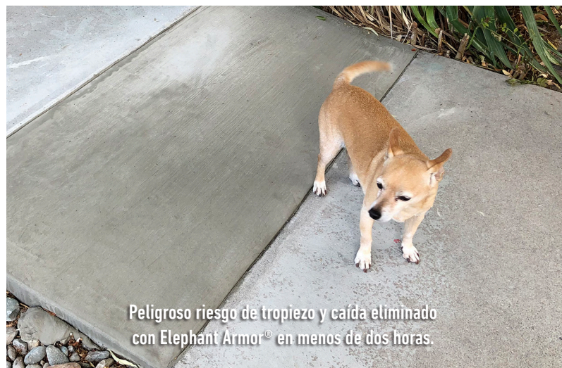
Peligroso riesgo de tropiezo y caída eliminado con Elephant Armor® en menos de dos horas.