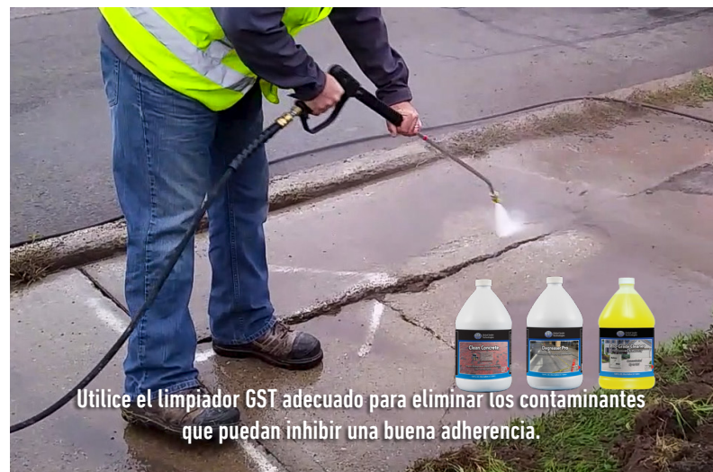
Utilice el limpiador GST adecuado para eliminar los contaminantes que puedan inhibir una buena adherencia.