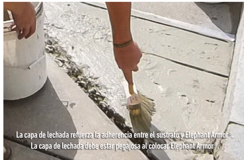
La capa de lechada refuerza la adherencia entre el sustrato y Elephant Armor®. La capa de lechada debe estar pegajosa al colocar Elephant Armor®.